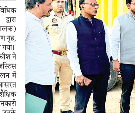
अधिकारियों को निर्देशित किया कि संस्थाओं में रह रहे बच्चों को गुणवत्तापूर्ण शिक्षा, संतुलित आहार, समुचित स्वास्थ्य सेवाएं और सुरक्षित वातावरण उपलब्ध कराया जाए। साथ ही उनके सर्वांगीण विकास के लिए सभी आवश्यक व्यवस्थाएं प्रभावी रूप से सुनिश्चित करने के निर्देश दिए गए।